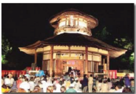
俳聖堂でのジャズ俳句