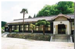
博要の丘（旧博要小学校）

手作り行灯によるまちづくり 紅花の活用した活性化活動 旧街道の活用（初瀬街道、大和街道）など