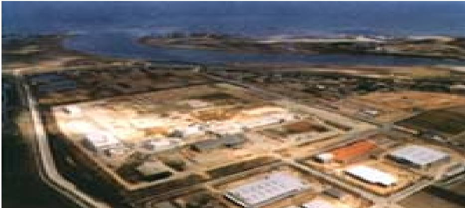
( 図 20 - 1 松阪浄化センター全容 )