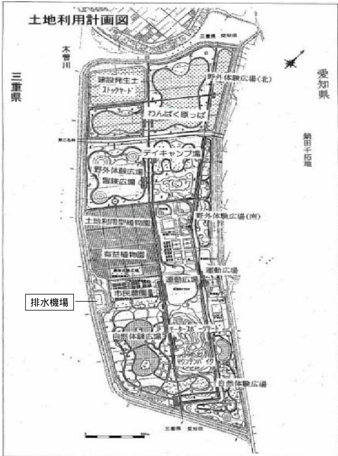
(図17 - 1 : 木曾岬干拓地土地利用計画図)