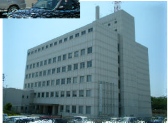
(三重県四日市庁舎)