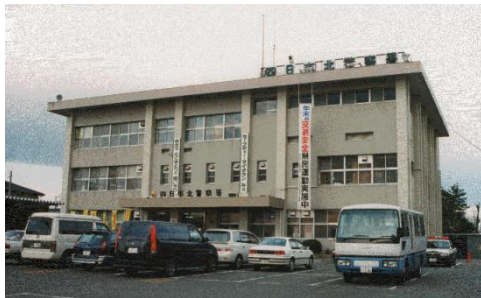
現四日市北警察署（昭和46年度建設）