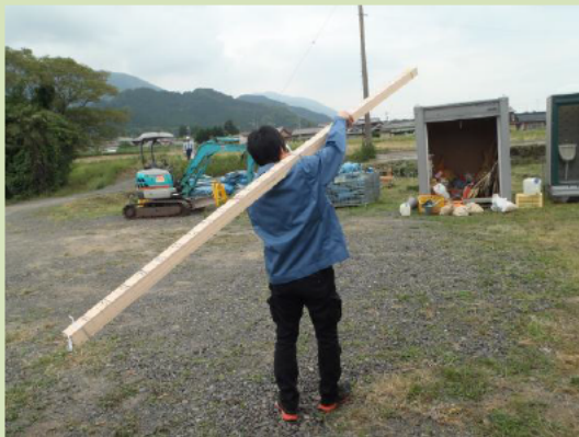
発掘作業の準備をしています