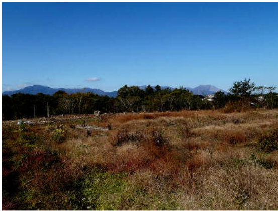
調査区を東から撮影しました。