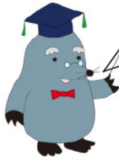
もぐ博士 (日焼け中)

いよいよ小牧南遺跡も調査開始だぞい。 ワシもこれまで遺跡発掘一筋。今年もがんばりますぞ！ で、今回はなにを掘るのじゃな？