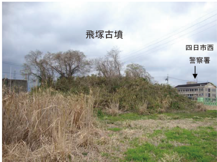
写真：飛塚古墳（北から）

今回の調査では、墳丘北側を発掘します。古墳のまわりを巡っていた溝（周溝）が見つかる可能性があります。