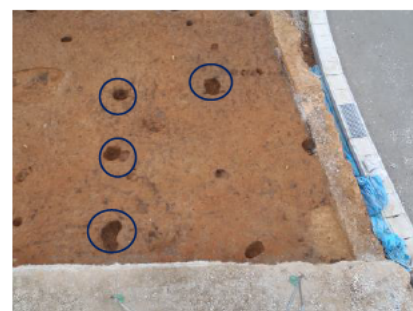
掘立柱建物の柱穴