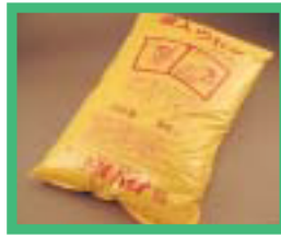
籾殻等使用の培土