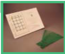
ペットボトル使用 の多目的ネット