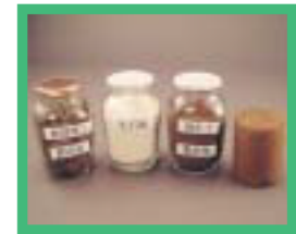
建設残土使用の 改良土

リサイクル製品の利用を推進することによって、リサイクル産業の育成を図り、循環型社会の構築に寄与することを目的に、平成13年3月、全国初の条例として「三重県リサイクル製品利用推進条例」を制定し、同年10月1日から施行しました。平成15年4月1日現在、42製品をリサイクル製品として認定しています。