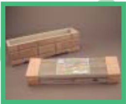
サイディング使用 のプランター