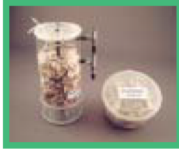
かき殻使用の 排水処理接触材