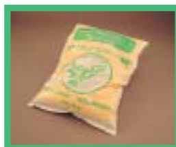
牛糞使用のたい肥