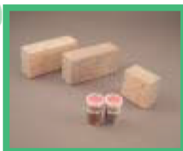
溶解スラグ等使用のイン ターロッキングブロック