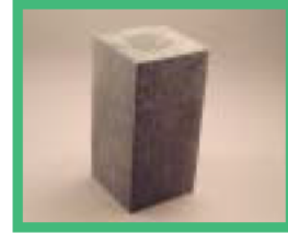
再生プラスチック の棒