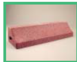
ゴムチップ使用の 車止め

※三重県リサイクル製品利用推進条例の内容及び認定リサイクル製品の概要・認定状況等は、ホームページ「三重の環境」( http://www.eco.pref.mie.jp/ )でもご覧いただけます。