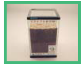
建設汚泥使用 の洗砂