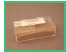
浄水スラッジ使用 の土壤改良材