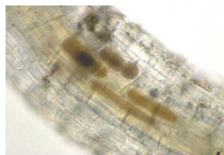
WYMVを媒介する菌の休眠孢子