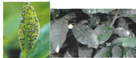
写真1. 成虫の発生状況 写真2. スス病の発生状況

結果は任意の圃場の発生程度であり、茶産地全体の平均を示すものではありません、このため未発生圃場においては、早期発見と早期防除対策につとめる必要があります。(野村茂広)