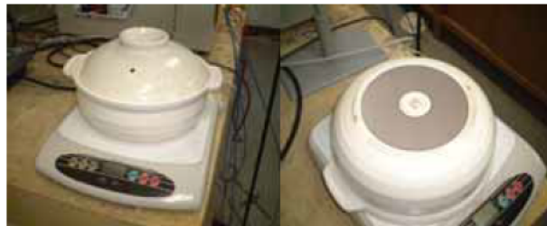
市販のIHクッキングヒーター用土鍋

土鍋の底の部分に銀の薄い膜を取り付けることによって発熱するようにしたものが電磁調理器用土鍋として市販されています。