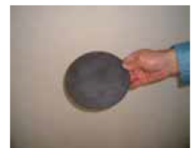
セラミックス製発熱体