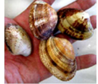
親貝の減少が問題となっている

三重県におけるアサリの年間水揚量は、ピーク時の1万5千トンから2千トン前後に激減しています。その原因としては、生息環境の悪化のほか、親貝の乱獲が指摘されています。