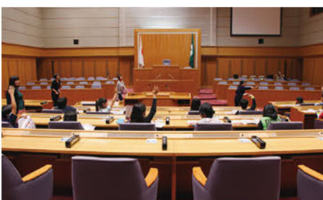
議事堂見学の様子

なお、本会議開催日等、議会運営の都合により見学できない日、場所がありますのでご了承ください。