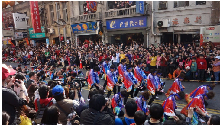
パレード会場 (安濃津よさこい)