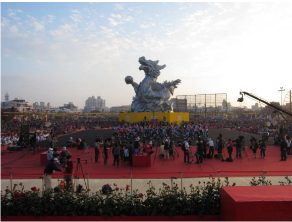
メインランタンと演舞ステージ