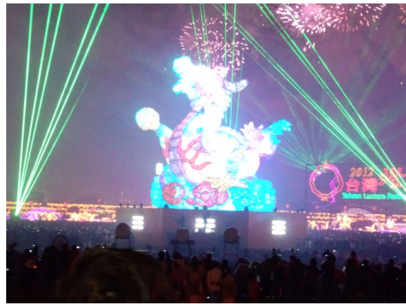
メインランタン (点燈)