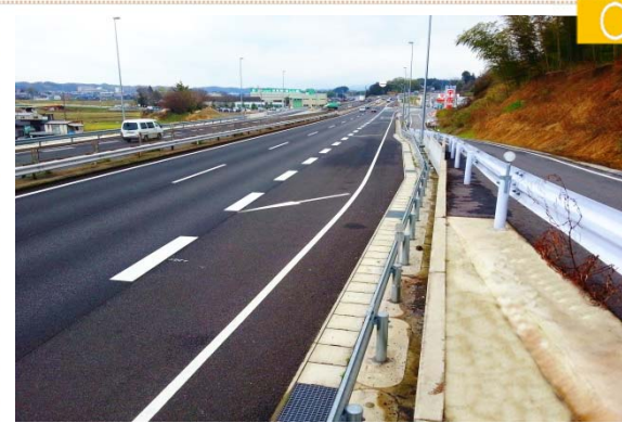
大阪方面 オンランプ 加減速車線長L=90mをL=210mに延伸