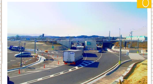
改良後 幅員狭小区間の解消