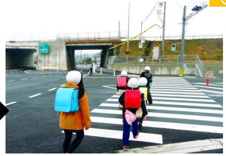
改良後 歩道幅 約1mを2mに拡幅