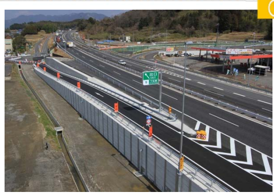
名古屋方面 オフランプ 加減速車線長L=125mをL=160mに延伸