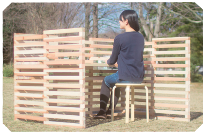
三重の木で組み立てるパリスペースキット