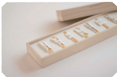
熨斗鮑(のしあわび)をつかった贈り物セット