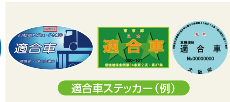
適合車ステッカー（例）