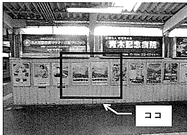
駅でのポスター掲出状況 (桑名駅) (H26. 6. 10～6. 23)