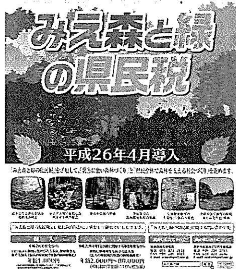
ポスター (平成26年度版)