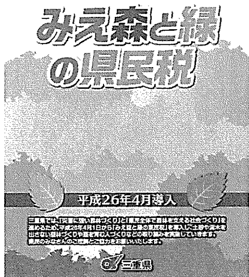
リーフレット (平成26年度版 表面)