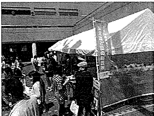
県民の日記念イベントでのPR状況 (H26. 4. 19)