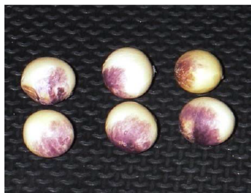
図 1 ダイズ紫斑病による被害粒の発生（紫斑粒）

本病は、ダイズの葉、茎、莢、種子の各部位に発病する病害です。特に種子での発病は、紫色の斑紋がへそを中心に発生し（紫斑粒・図 1）、外観品質を低下させる要因となります。三重県内では、種子更新や種子消毒が徹底されたため、近年の多発は見られませんが、ダイズの重要病害です。