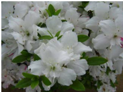
開花株の花の様子