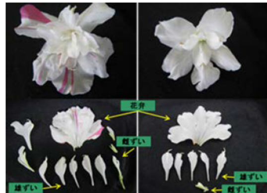
同一株内で見られる開花状態 (上段：全体図、下段：解剖図)