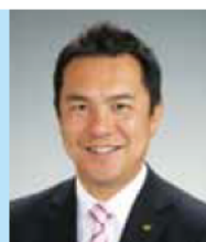
三重県知事 鈴木英敬