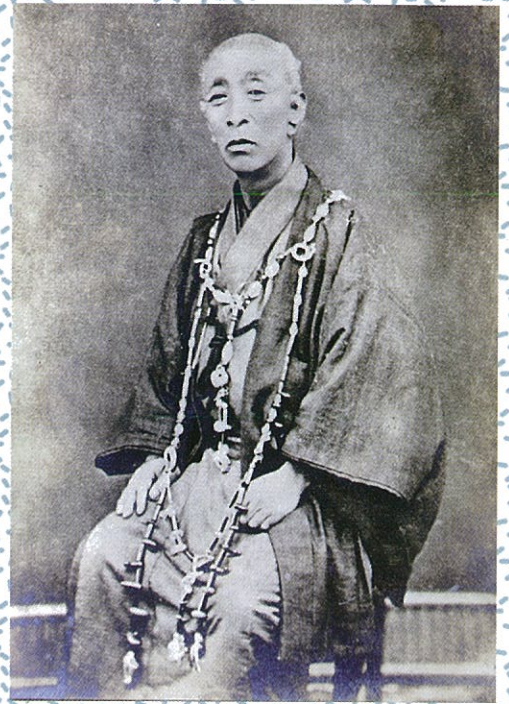
生涯ただ一枚の写真

幕末から明治維新に活躍した松浦武四郎は、生涯にわたり全国を歩き続ける。旅行家・探検家・作家・出版社・学者・・・たぐいまれなる知識欲と冒険心で、多芸多才ぶりを発揮したが、数々の業績の中で人びとの記憶に刻み込まれてきたのは、『北海道の名付け親』であること。さまざまな価値観を受け入れる広い心、偏見を持たない眼、常に先を切り拓く力・・・武四郎の歩みは大きな足跡となって今ここによりみがえる。