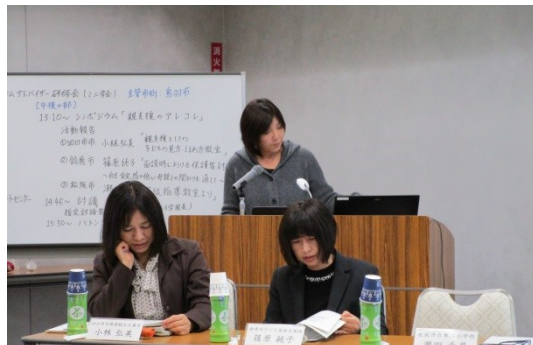
シンポジウム「親支援 ア・レ・コ・レ」 四日市市・鈴鹿市・松阪市

この研修会は、各市町において発達障がい児に対する途切れのない支援を行うため、専門的な知識をもって地域の