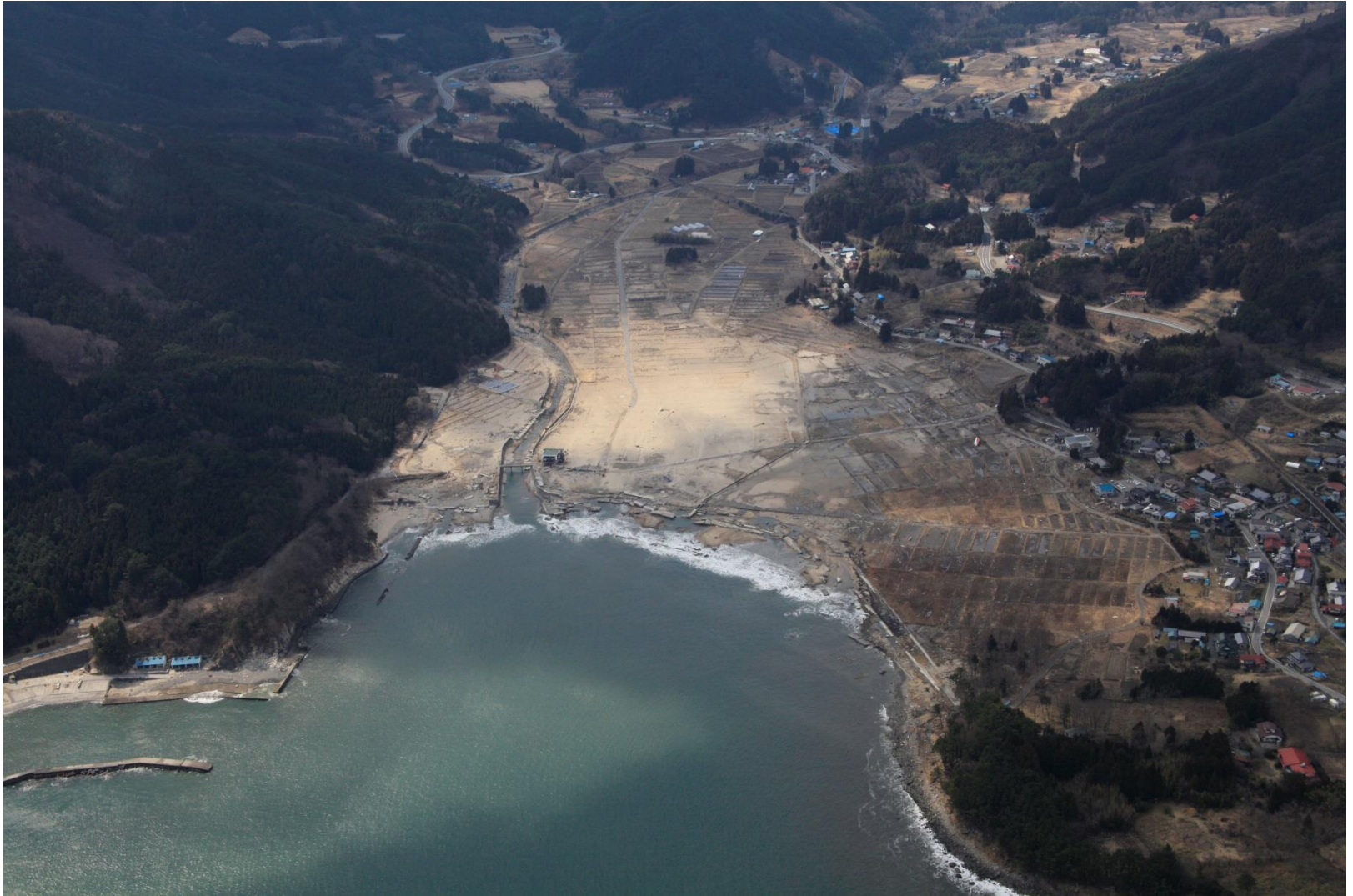
大船渡市 吉浜海岸 2011年3月29日撮影