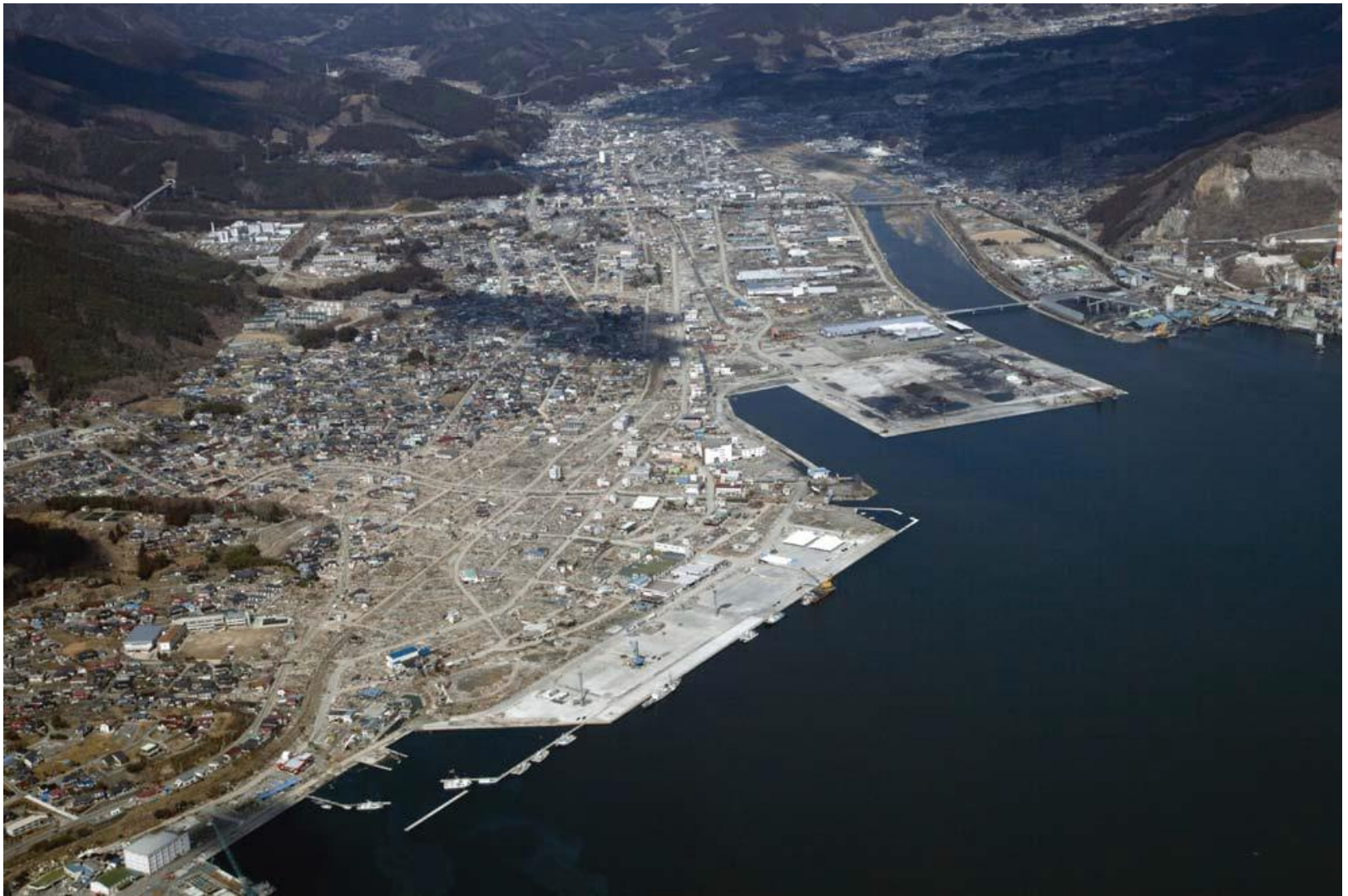
大船渡市盛町 2011年3月28日撮影

平成23年6月 社団法人 東北建設協会(現 一般社団法人 東北地域づくり協会)作成 東日本大震災支援活動 より