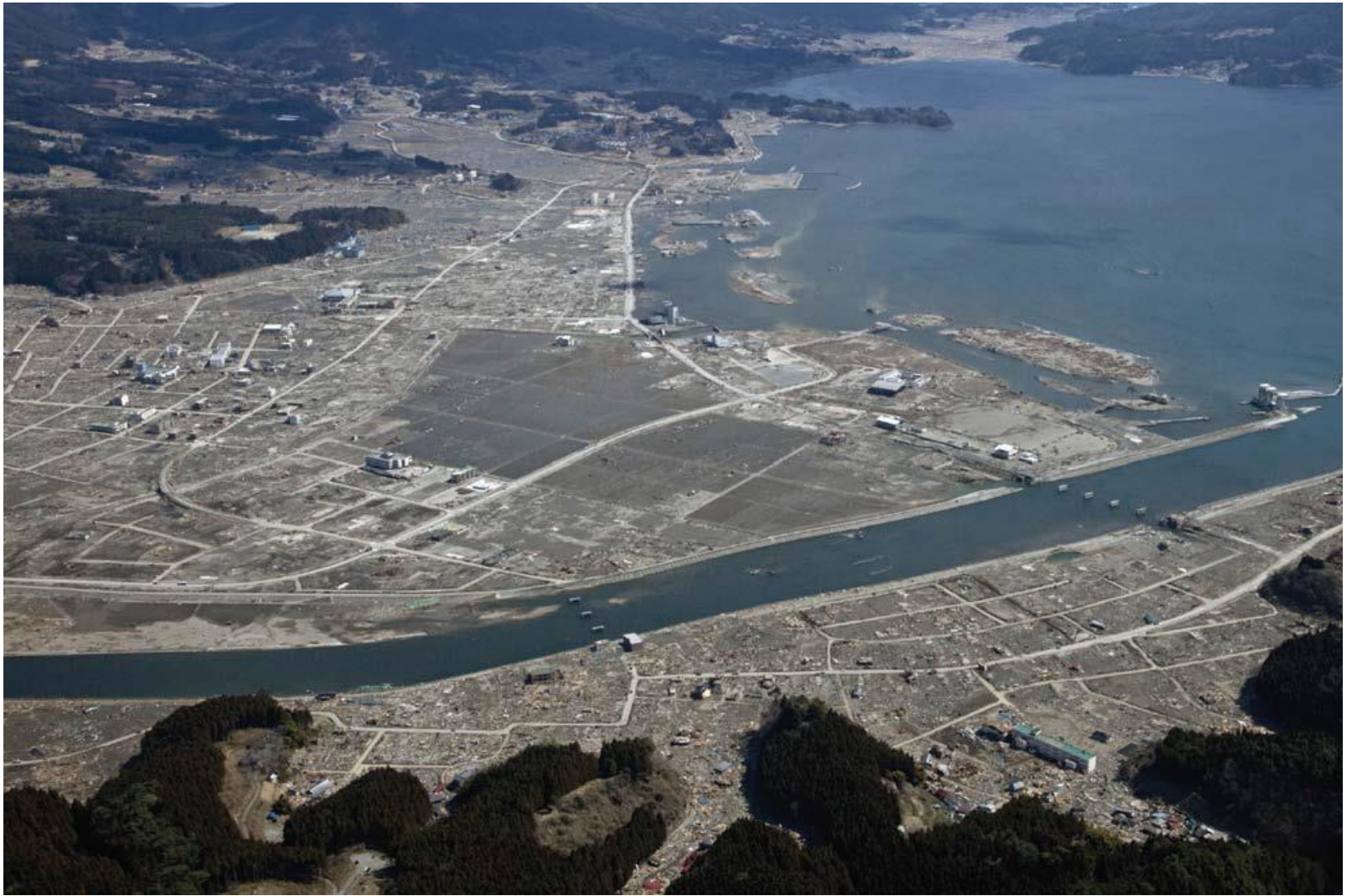
陸前高田市 2011年3月28日撮影

平成23年6月 社団法人 東北建設協会(現 一般社団法人 東北地域づくり協会)作成 東日本大震災支援活動 より