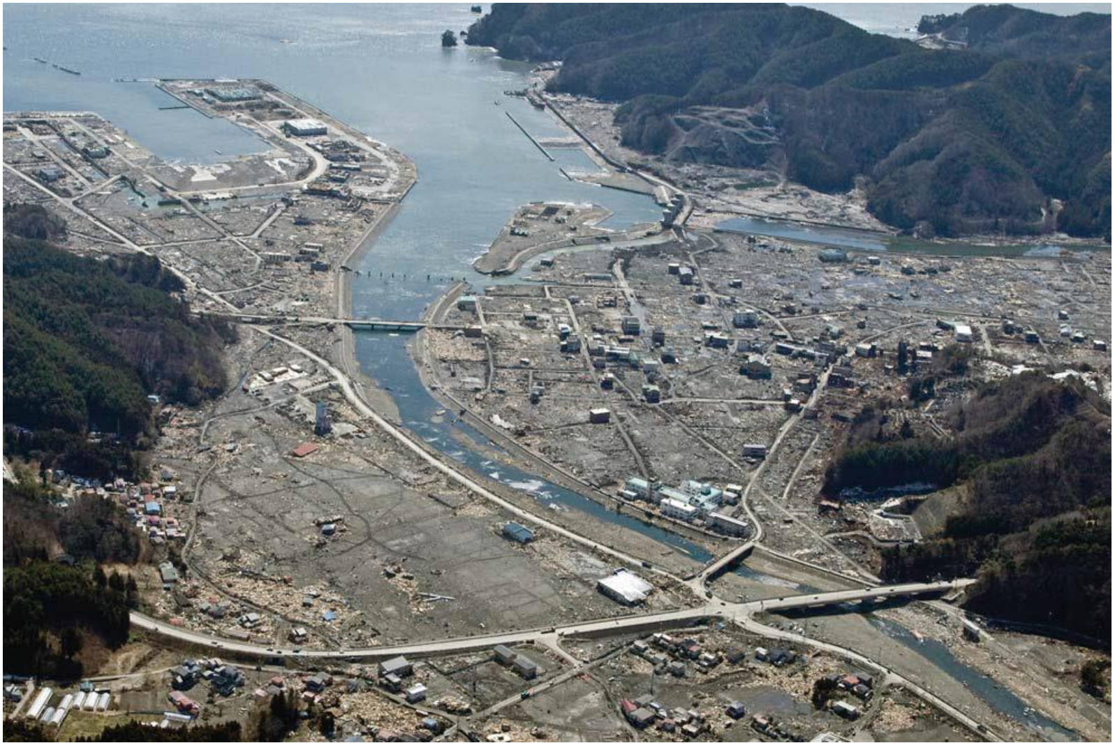
大槌町 2011年3月28日撮影

平成23年6月 社団法人 東北建設協会(現 一般社団法人 東北地域づくり協会)作成 東日本大震災支援活動 より