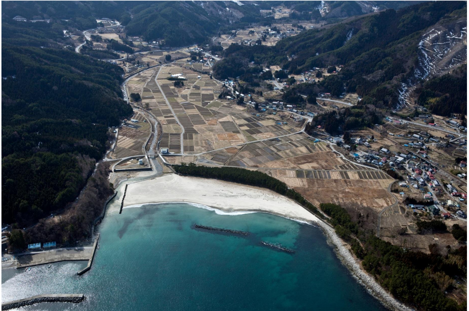
大船渡市 吉浜海岸 2010年3月14日撮影