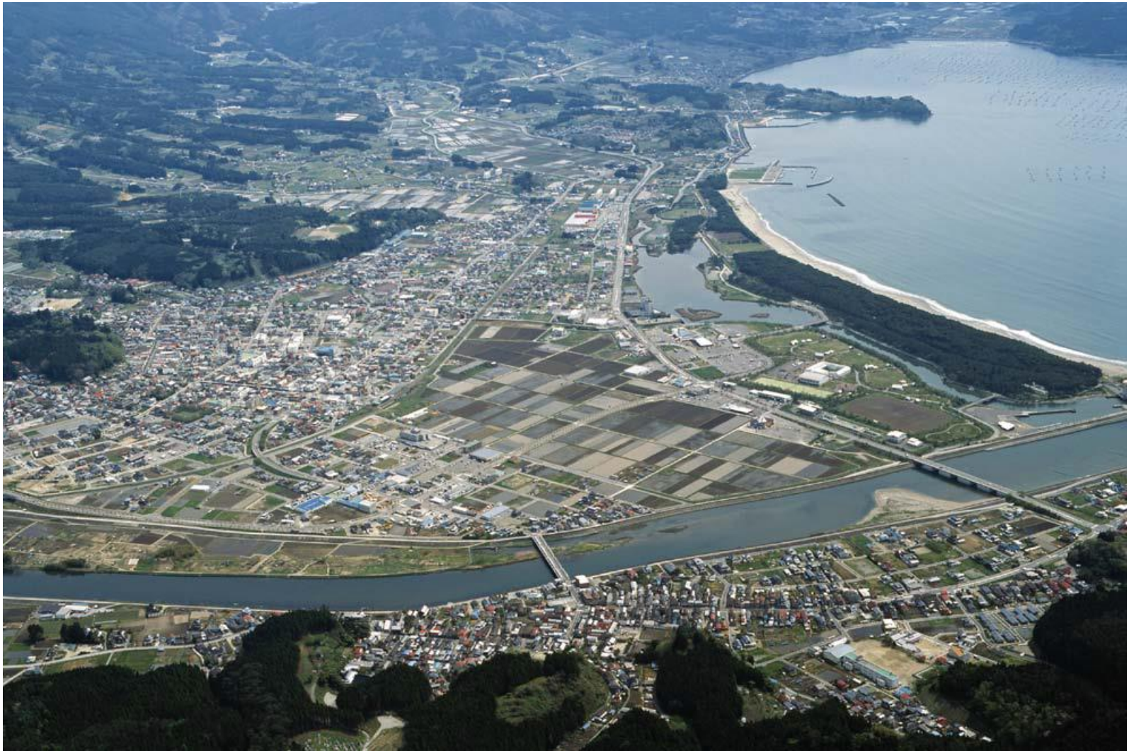
陸前高田市 2007年3月撮影

平成23年6月 社団法人 東北建設協会(現 一般社団法人 東北地域づくり協会)作成 東日本大震災支援活動 より