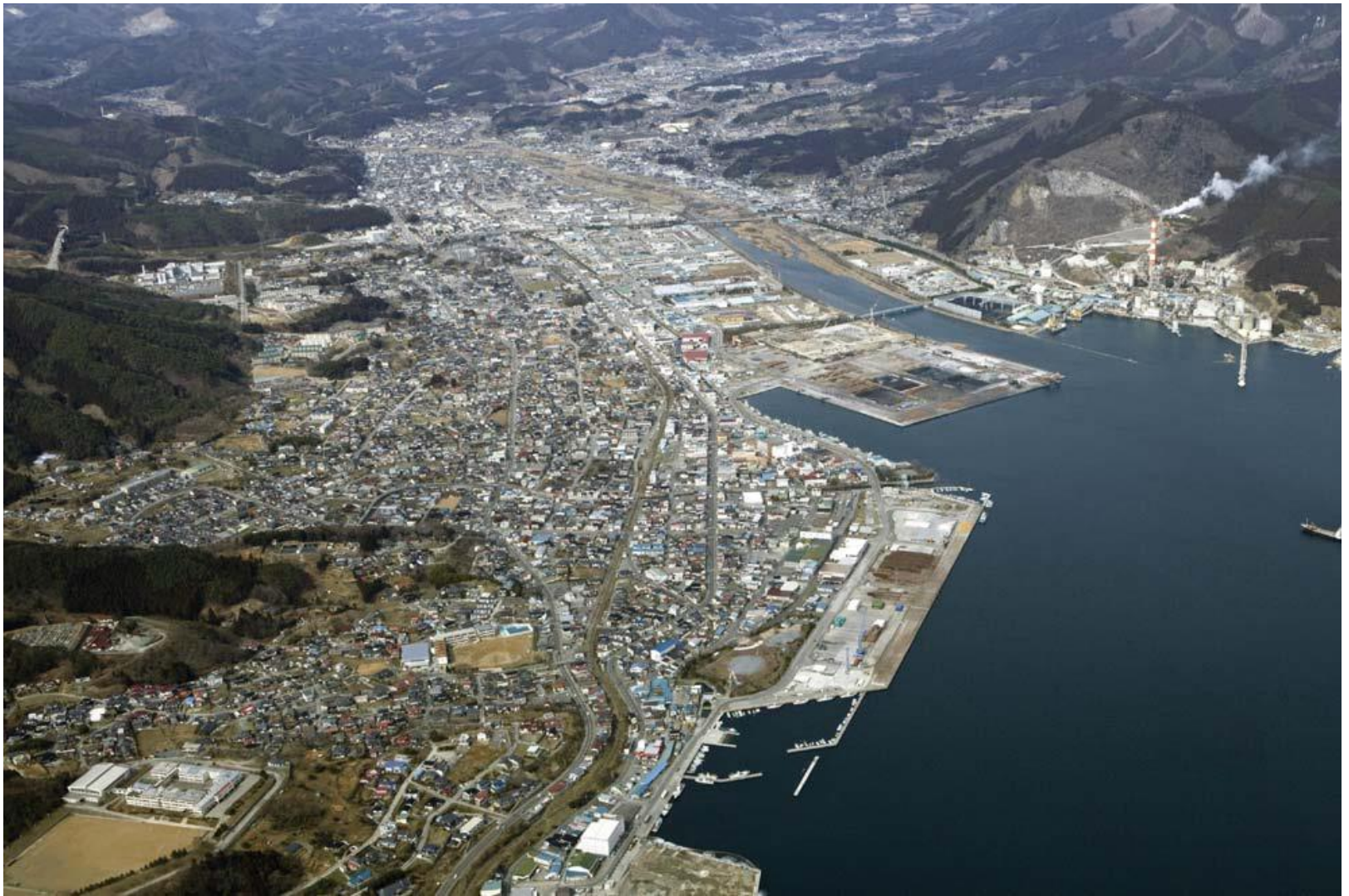
大船渡市盛町 2010年3月撮影

平成23年6月 社団法人 東北建設協会(現 一般社団法人 東北地域づくり協会)作成 東日本大震災支援活動 より