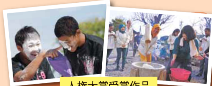
人権大賞受賞作品