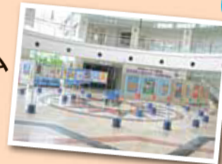
人権センターアトリウム