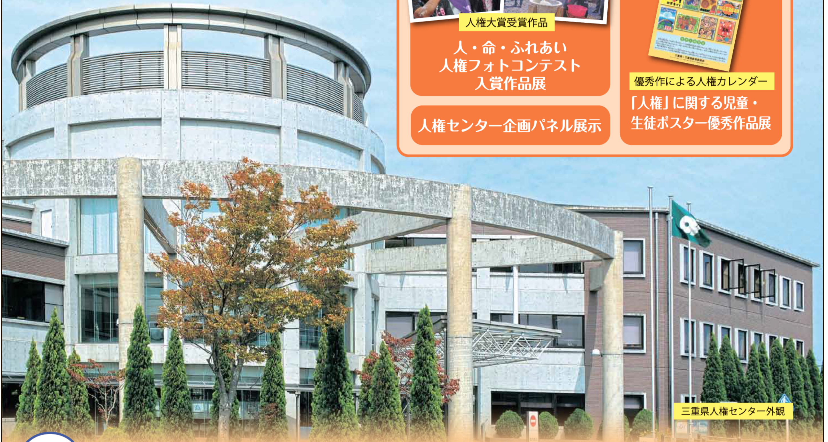
三重県人権センター外観