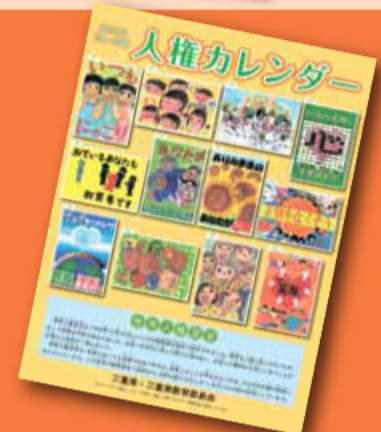
優秀作による人権カレンダー