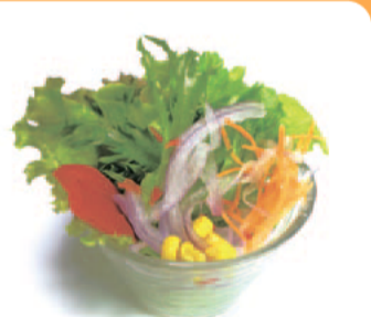
県産水耕栽培サラダバー