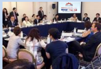
H27.8開催 女性が輝く社会に向けた 国際シンポジウムwaw!2015