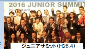
ジュニアサミット(H28.4)