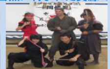
外国人観光客に人気の忍者ショー