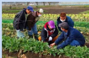
ナバナ栽培研修を受講している 障がい者の皆さん