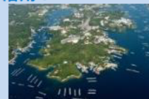
指定70周年を迎える 伊勢志摩国立公園