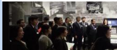
四日市公害と環境未来館の視察