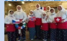
海女のコスプレを楽しむ外国人観光客