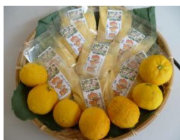
(ゆずを活用した既製品)