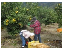
(ゆずの収穫の様子)