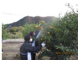
(ゆずのトゲ切りの様子)