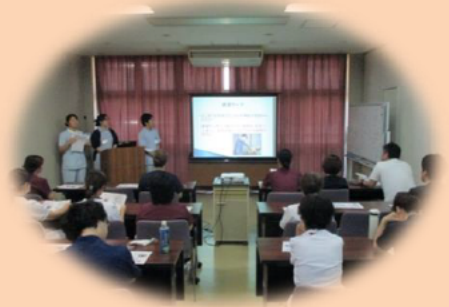
研修の成果を発表