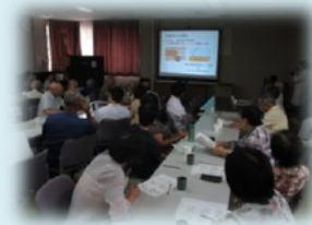
8月の健康教室の様子