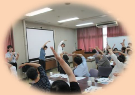
健康教室にて参加者の方に体操を実演