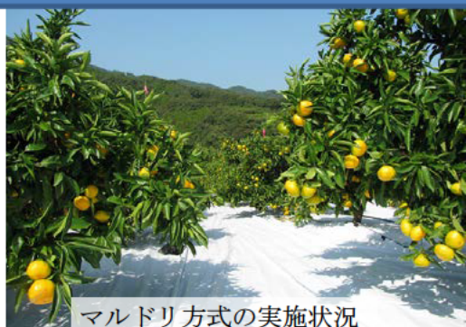
マルドリ方式の実施状況