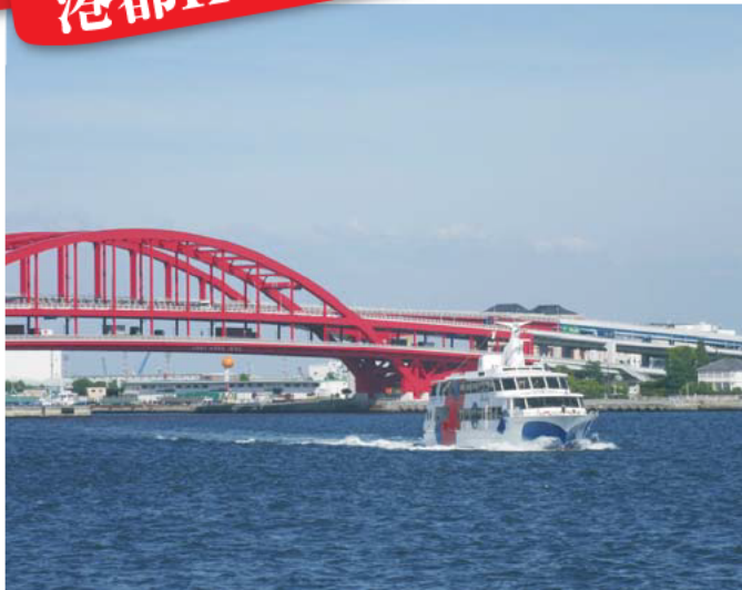
神戸シーバス ファンタジー号