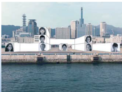
<風の回廊> 井上廣子+井上凱彦建築計画事務所

港都KOBE芸術祭について詳しくはこちらへ http://www.kobe-artfes.jp/