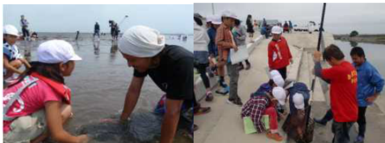
小学生との干潟観察会