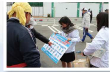
第10回美三国三重市町対抗駅伝でPR活動を実施