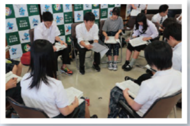
大会の成功に向けてPR企画を検討中