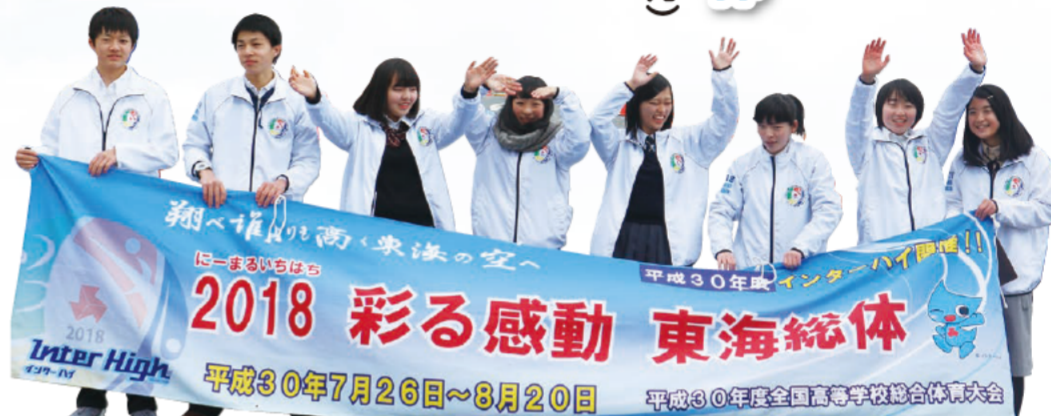
2018 彩る感動 東海総体 平成30年7月26日～8月20日