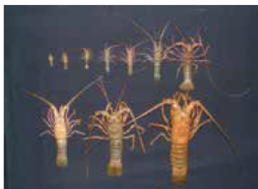
イセエビの成長過程