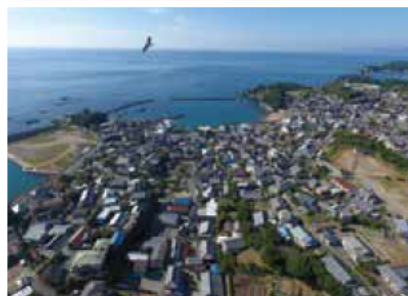
志摩町越賀から熊野灘を望む

三重県総合博物館と三重大学は、平成26年度から28年度までの3年間、先志摩半島(志摩市志摩町)で総合的な共同研究を行ってきました。本展では、その研究成果にもとづき、先志摩の自然と歴史・文化の魅力をご紹介します。まず、江戸時代の越賀村の空間構造を端緒として、過去と現在の景観の移り変わりをご覧いただきます。また、当地域で盛んなイセエビ漁に焦点を当て、漁で用いられる道具や動画、イセエビの成長過程がわかる資料などを通して、海の恵みを得るために助け合う漁村の暮らしを紹介します。