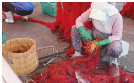
網からイセエビを外す