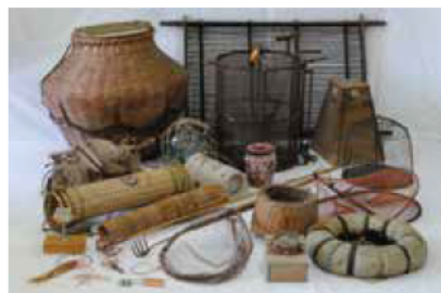
国の登録有形民俗文化財 「志摩半島の生産用具及び関連資料」 (志摩市蔵)※一部の資料を展示します