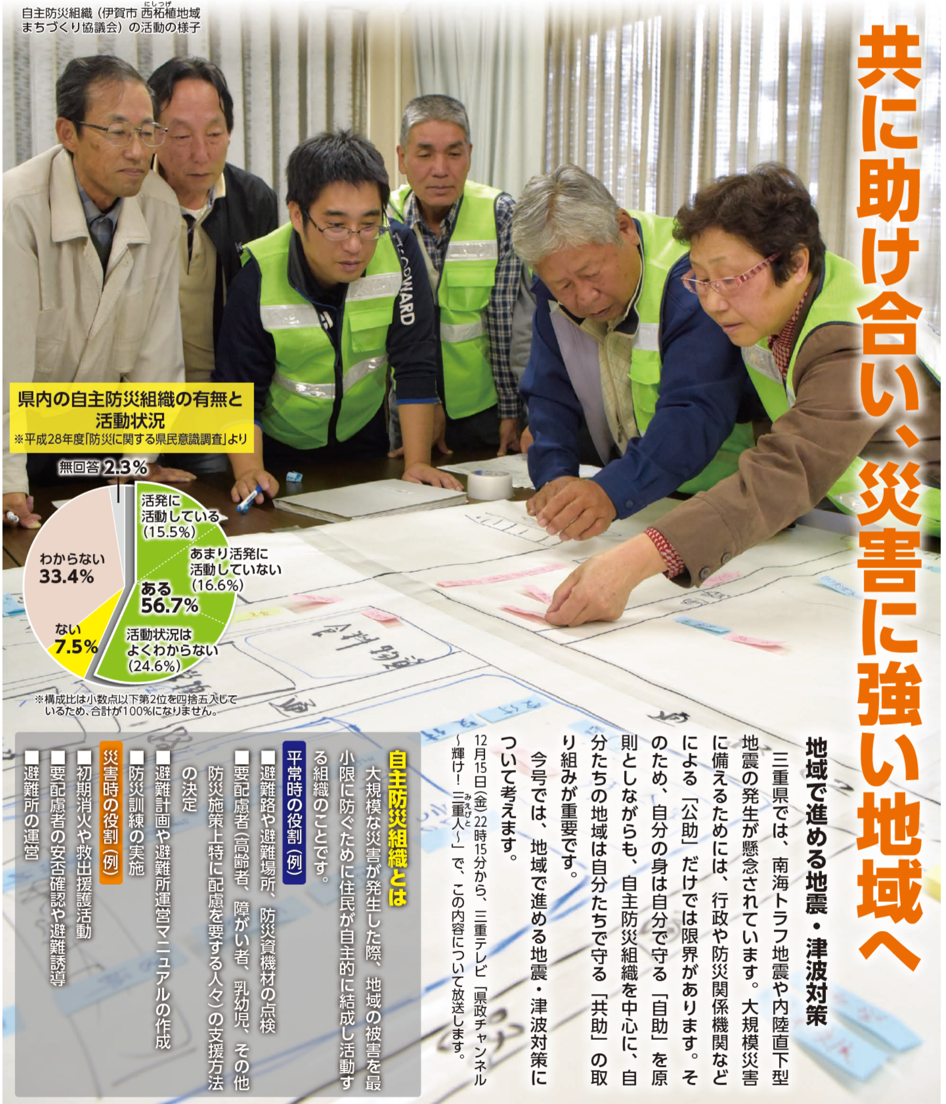
自主防災組織(伊賀市 西柘植地域 まちづくり協議会)の活動の様子

「県政だより みえ」は政策情報を中心に、毎月第一日曜日に新聞折り込みでお届けしています。イベントやお知らせなど暮らしに役立つ最新情報はデータ放送でご覧いただけます。