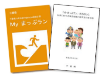
津波避難に関する三重県モデル

「My まっぷラン」を活用した地域における津波避難計画策定の手引きは、県のホームページからダウンロードできます。