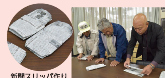
新聞スリッパ作り