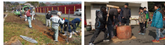
地域の皆さんで、サルなどの侵入を防ぐ防護柵を設置。耕作放棄地で採れたもち米を使った子どもたちの餅つき大会。

三重県公式フェイスブックに取材後の皆さんのご褒め話などを投稿します! ぜひ「いいね!」や「シェア」をし、県内で活躍する「三重のひと」を応援してください! 三重県 Facebook Q検索