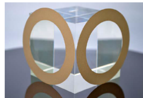
カッティングブレード

各工程で残留した内部応力が、最終工程により十分除去されることが確認され、工程改善、製品の高信頼性化につながった。 今後はひずみ取り工程の最適化を検討する予定。