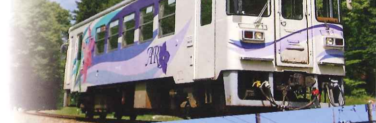
養老鉄道 (ようろうてつどう)