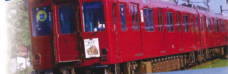
樽見鉄道 (たるみてつどう)