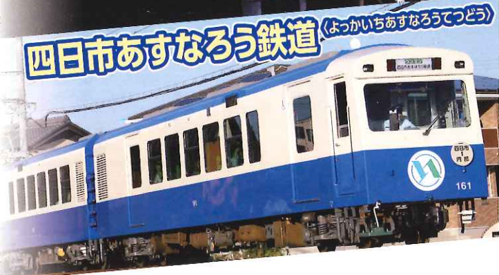
四日市あすなろう鉄道 (よっかいちあすなろうてつどう)