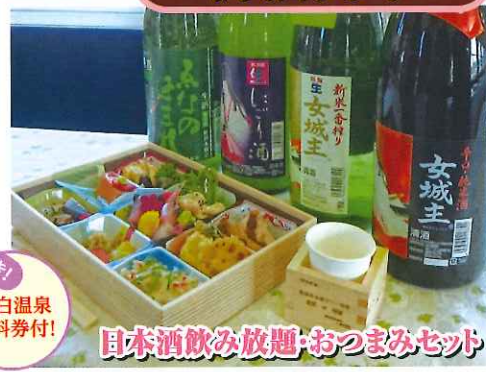
日本酒飲み放題・おつまみセット

お問合せ・お申込みは... 明知鉄道株式会社 TEL (0573) 54-4101 FAX (0573) 54-4302 〒509-7705 岐阜県恵那市明智町469-4 http://www.aketetsu.co.jp/