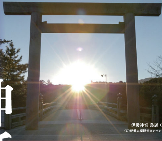
伊勢神宮 鳥居 (三重県)