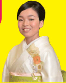
あき こ じょ おう でん か 彬子女王殿下

寛仁親王殿下の第一女子として誕生。学習院大学を卒業後、オックスフォード・マートンコレッジに留学。日本美術を専攻し、海外に流失した日本美術に関する調査・研究を行い、2010年に博士号を取得された。女性皇族として博士号の取得は史上初のことである。子どもたちに日本文化を伝えるために、ご自身で一般社団法人「心游舎」を創設、総裁に就任され、全国各地でワークショップなどを行われている。