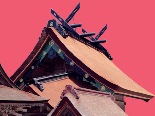
出雲大社 本殿(島根県)

日本の古代国家形成にあたり 重要な役割を果たした伊勢、大和、出雲… いにしえを物語る多くの史跡や 神社仏閣が、今に護り伝えられています。 古代浪漫に満ちあふれ、人々の心を魅了する 豊かな神話伝承や祭儀が 今なおこの地には生き続けています。 そんな神話と聖地を巡る旅のもつ意味や魅力 未来への可能性などを学びます。 古代から現代へ、時を超えて受け継がれる 神話の世界へと心の旅に出かけましょう。