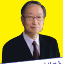
基調報告・パネリスト

寛仁親王殿下の第一女子として誕生。学習院大学を卒業後、オックスフォード・マートンコレッジに留学。日本美術を専攻し、海外に流失した日本美術に関する調査・研究を行い、2010年に博士号を取得された。女性皇族として博士号の取得は史上初のことである。子どもたちに日本文化を伝えるために、ご自身で一般社団法人「心游舎」を創設、総裁に就任され、全国各地でワークショップなどを行われている。