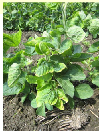
現地大豆ほ場で発生した萎縮症状