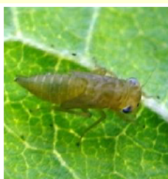
カンキツヒメヨコバイ幼虫