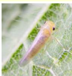
カンキツヒメヨコバイ成虫