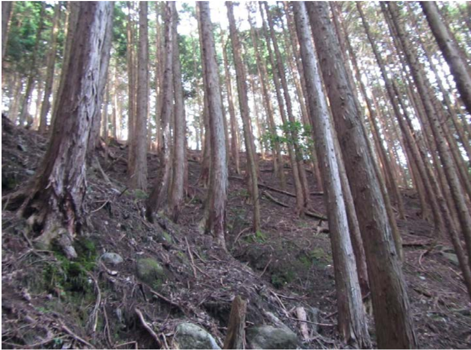
山腹部 調整伐 整備前