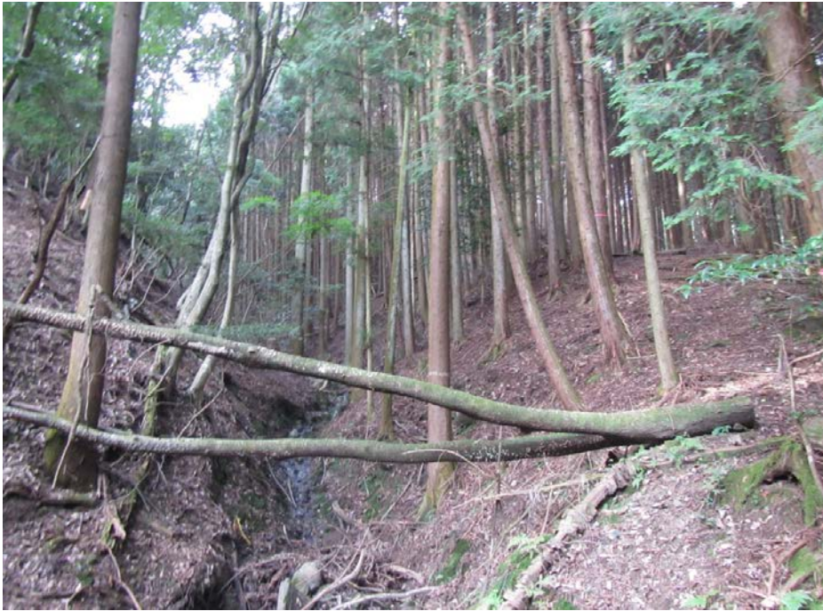
溪流部・溪岸部 危険木除去 整備前