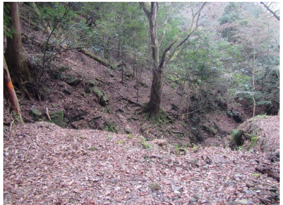
溪流部・溪岸部 危険木除去 整備後