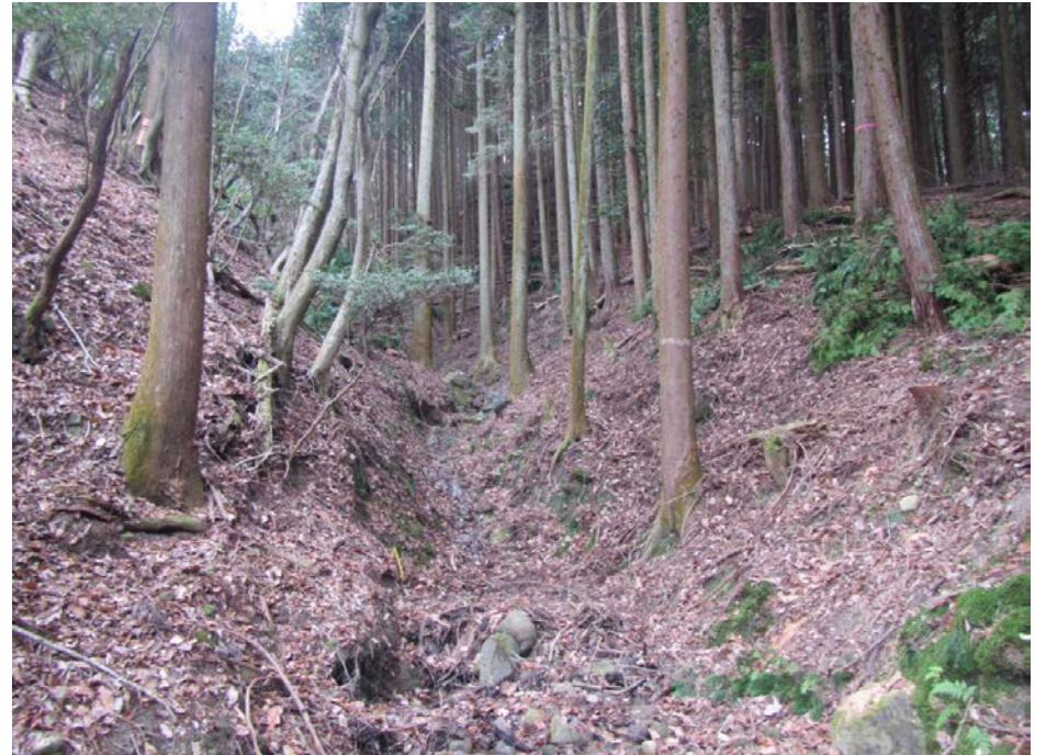
溪流部・溪岸部 危険木除去 整備後