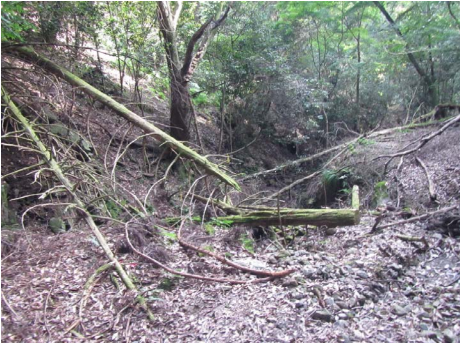
溪流部・溪岸部 危険木除去 整備前