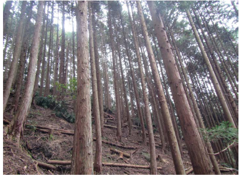
山腹部 調整伐 整備後