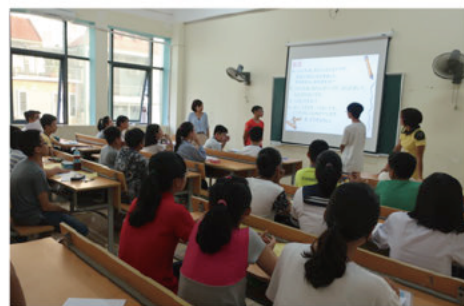
中学生授業 会話練習

学校施設とはまた違った環境なので、集客や存続に関しても対策を考えなくてはなりません。課題は色々ありますが、残り約一年、自分の出来る事をコツコツと積み重ねていきたいと思っています。