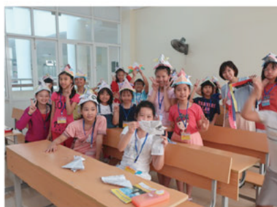
小学生クラス 手作りかぶと