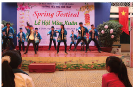
ソーラン節の発表