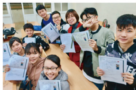
三重県熊野市の高校生と文通しました