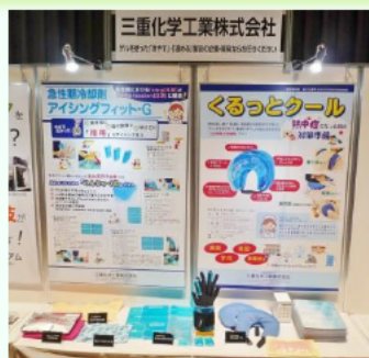
出展ブースの様子