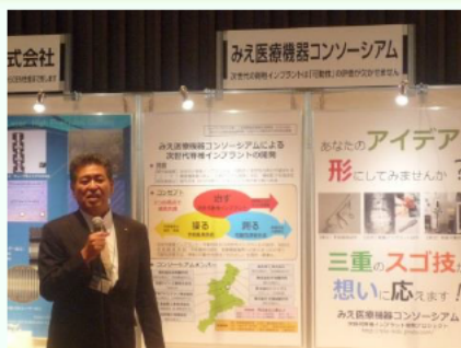
ショートプレゼンの様子