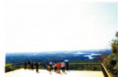
横山展望台と英虞湾