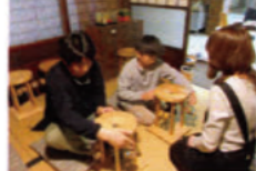
伊賀くみひも体験