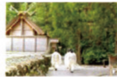
伊勢神宮 日別朝夕大御饗祭

インバウンド誘客のため、豊かな自然や有形無形の文化資源を活用した体験プログラムの開発