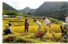
丸山千枚田 福刈体験