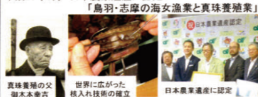
真珠養殖の父 御木本幸吉 世界に広がった 核入れ技術の確立 日本農業遺産に認定

本県で誕生した独創的技術、120年以上続く一大産地 平成29年3月 日本農業遺産に認定 「鳥羽・志摩の海女漁業と真珠養殖業」