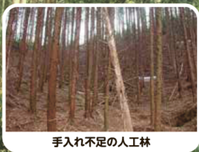
手入れ不足の人工林