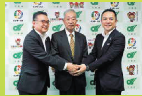
左:遠水亨特別顧問、中央:太田猛彦学長、右:鈴木英敬知事