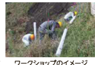
ワークショップのイメージ

内容 伐採、搬出、植林の一環作業システムについて 林業関係者のみなさんと考えるワークショップです。