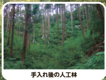
手入れ後の人工林