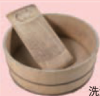
洗濯板とたらい (昭和)