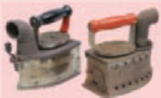
炭火アイロン (明治)