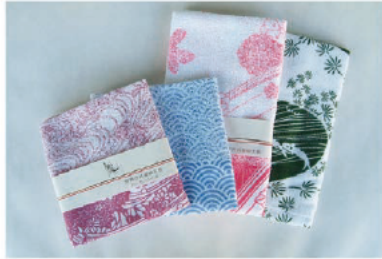
伊勢古式着物文様 おぼろ染めガーゼハンカチ おぼろ染めと伊勢型紙の文様が織りなす伝統美を感じるデザイン。抜群の吸水・速乾性と肌触りの良さが魅力。 540 円 (税込) から