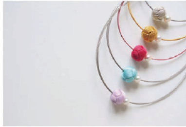
伊賀 BONBON 伝統工芸品・伊賀くみひもと伊勢志摩産のアコヤ真珠を使用した商品。美しさ、高級感を活かしたデザインです。 15,120 円 (税込)