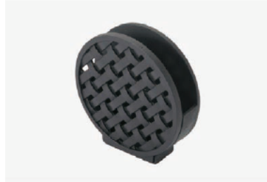
hiecka 縦型蚊遣り器 「女性のライフスタイルに寄り添う鋳物雑貨」がコンセプトの桑名鋳物。和室・洋室どちらでも似合うデザイン。 6,480 円 (税込)