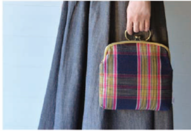
伊勢木綿「ichi ガマ 鞆」 伝統工芸品・伊勢木綿の風合いと柄を上手に見せたデザイン。細やかなところにもこだわりぬいた、実用的な商品。 6,200 円 (税込)

三重県の伝統産業・地場産業や地域資源を活用した商品の中から、伝統的な技術または技法を用いて製造された、機能性、デザイン性に優れた革新的な商品を三重県が選定しています。Mikke ではその一部商品をお買い求めいただけます。