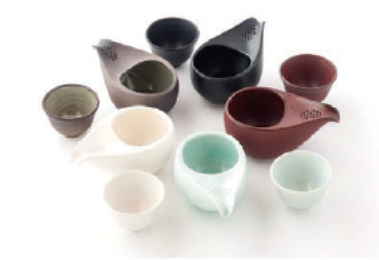
ひとしづく 〈至高急須シリーズ〉 美味しさと使いやすさを追求した萬古焼の急須。高度な穴あけ技術を活かして作られ、手軽にお茶を入れられます。 小 3,240 円 (税込) 大 3,780 円 (税込)