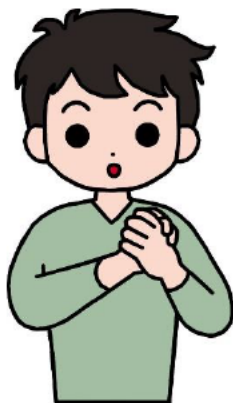
なかま とも 仲間・友だち