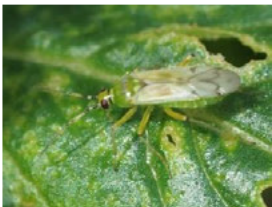
タバコカスミカメ